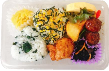
R-1 おにぎりプチパック